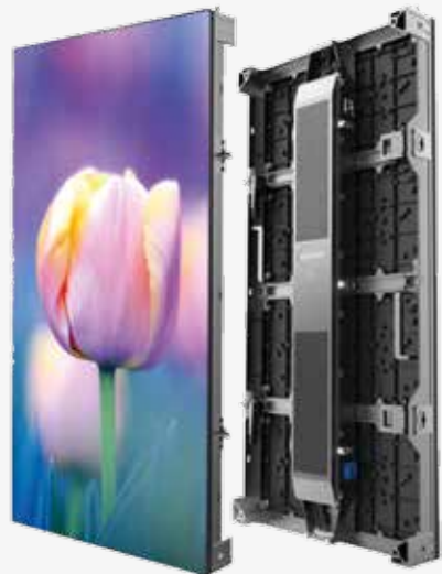
500 x 1000 mm