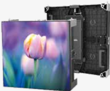
500 x 500 mm